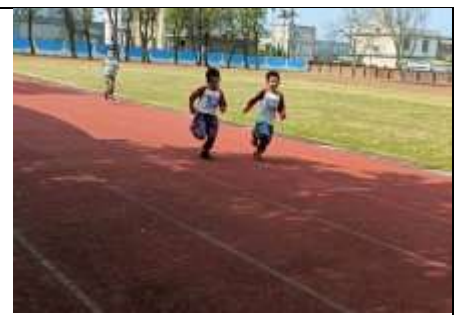
用年齡分組，比賽跑一圈操場

因為前幾次的跑步活動，發現寶貝們在跑步時都會闖到別人的跑道，尤其是中班跟小班，無法遵守跑在自己跑到的遊戲規則。於是，老師設計走直線的活動，希望可以帶給幼兒直線的概念。首先，在每天的戶外活動時，先帶小孩在籃球場上紅色磚頭、白線上走一走，有時候是慢慢走，有時候是學習螃蟹走路、兔子跳、小鳥飛等動作，讓幼兒從重複練習中認識直線。接著，老師帶幼兒藉由遊戲學習走直線。