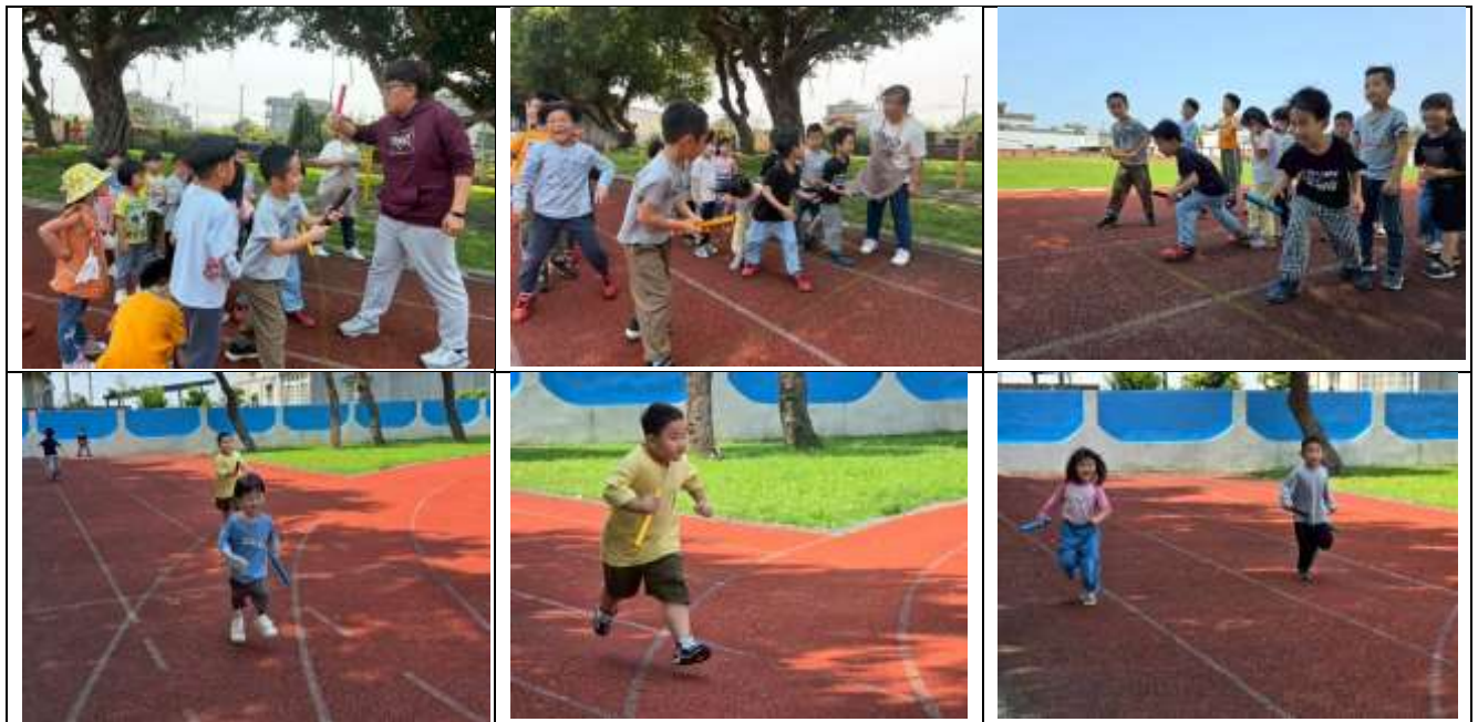
幼兒練習用接力棒進行跑步接力活動

這次的跑步活動加入兩個新的元素：接力棒和號碼衣。老師分別先介紹這兩項物品的功用：號碼衣是讓同一隊的夥伴可以知道自己的同隊隊友是誰，把接力棒交給自己同隊的夥伴；而接力棒是代表手握接力棒的人才可以跑步，而先跑的人會先握著接力棒，等到遇到自己的隊友時，就把接力棒交給隊友，這樣拿到接力棒的人才能出發跑步。說明完規則後，老師先利用接力棒進行跑步活動，但由於是孩子第一次使用接力棒跑步，所以老師設計短短的路程，且是拿到接力棒往前跑並碰到牆壁後就往回跑，再把接力棒交給下一位。這場接力跑步孩子都玩到很開心，很期待之後可以真正的跑一圈操場進行接力比賽！