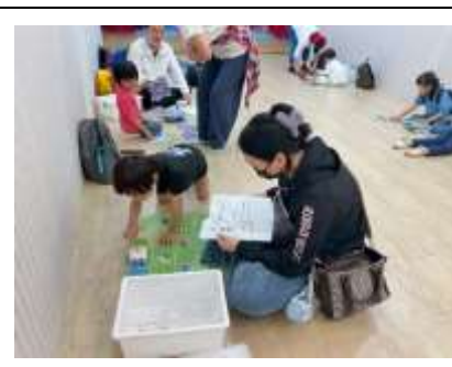
家長陪同孩子一起遊戲，共同創美好的回憶