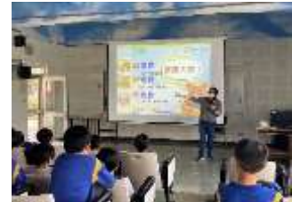
真食物、好食物及全食物