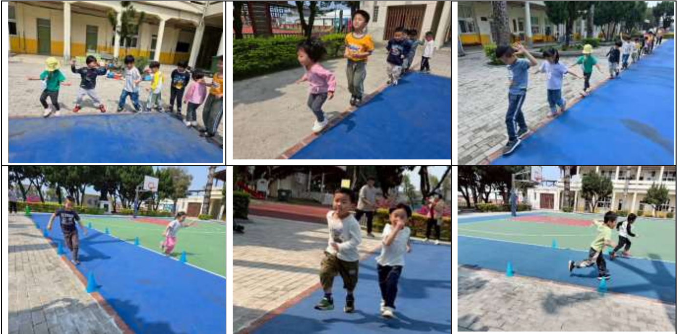
幼兒練習走、跑直線

老師或同儕示範一次，才能抓到轉圈的概念。全班都轉圈走完直線後，老師增加活動難度，就在直線上擺小圓錐，小孩需要用S型的方式繞過小圓錐重複玩了幾次走/跑直線後，孩子漸漸掌握直線跑步、直線走路的技能，希望之後跑步活動時，寶貝們能遵守規則，在自己的跑道中跑步就好。