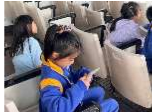
仔細觀察糙米、白米差異