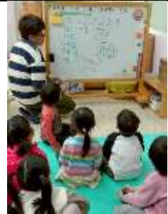
老師和幼兒一起團討，討論目前進行哪些運動