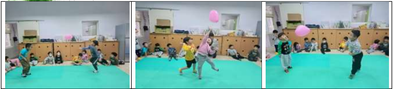
幼兒用氣球進行自己拍球、兩人互相對拍球的遊戲