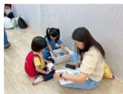
體驗每一場館中不同的遊戲